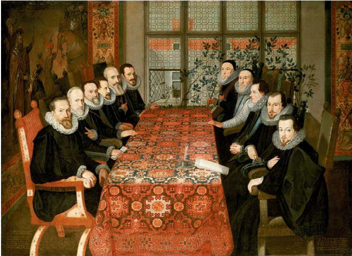
Summerset House Conference

Al in het vorige jaarverslag werd melding gemaakt van een toename van het GMR-werk. Naast nieuwe regelingen binnen de wetgeving, vernieuwingen in het onderwijs en meer uitgebreide bevoegdheden spelen ook de huidige problematieken in het onderwijsveld zoals werkdruk, Passend Onderwijs, krimp en het lerarentekort een rol. INNOVO moet inspelen op die problemen en dat vraagt ook van de GMR een meer flexibele houding, waarbij soms snel en toch adequaat ingespeeld moet worden op verzoeken vanuit het CvB. Vooral in het voorbereidende werk gaat steeds meer tijd zitten. Ook zien we, dat steeds meer medezeggenschapsraden de GMR als vraagbaak weten te vinden. Zowel mondeling als per mail stijgt het aantal vragen om informatie.